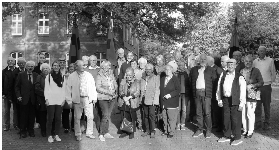
Foto vom Bezirkstag der KAB 20.10.2018 in Paderborn Haus Maria Immaculata

All diese Informationen sind auch im Internet http://www.kab-shs.de unter Termine zu finden!