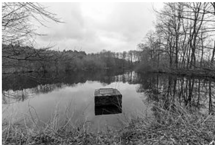
Naturschutzgebiet Kipshagener Teiche

Der erste Wandernachmittag im neuen Jahr startet am 07. Februar 2019 unter bewährter Leitung. Hubert Schlepphorst und Manfred Schwede wollen sich mit den „Bewegungswilligen“ an diesem Tag um 14.00 Uhr am Pfarrer – Rüsing – Haus treffen. Wir wandern zum Naturschutzgebiet „Kipshagener Teiche“ bis zum Café Wölke (Brunnencafe) in Stukenbrock, dort können wir die verbrauchten Kalorien mit einer kleinen Stärkung wieder auftanken.